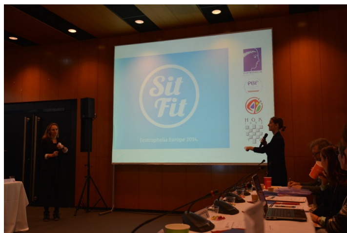
Hrvatski tim na natjecanju ECOTROPHELIA EUROPE, 20. listopad 2014., Pariz