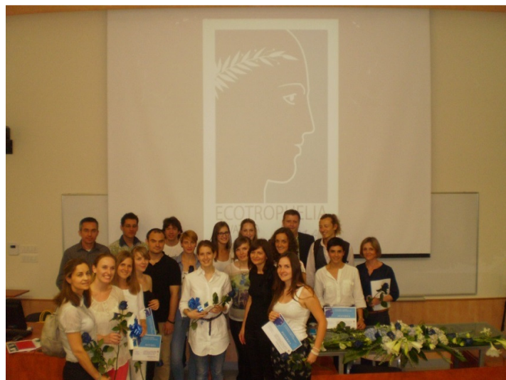
Natjecanje ECOTROPHELIA HRVATSKA 2014, 09. lipanj 2014., Zagreb